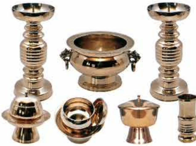
방자 민줄 촛대 Set 대, 중, 소 공통 이미지