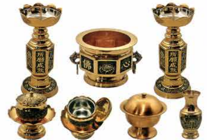
금색 육각불심 촛대 Set 대, 중, 소 공통이미지