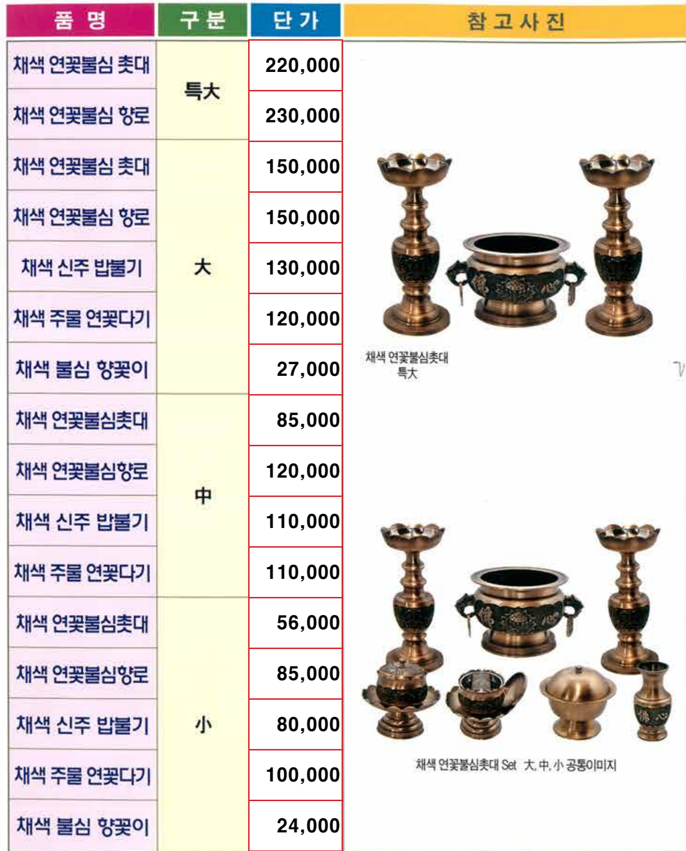
채색 연꽃불심 촛대 특대