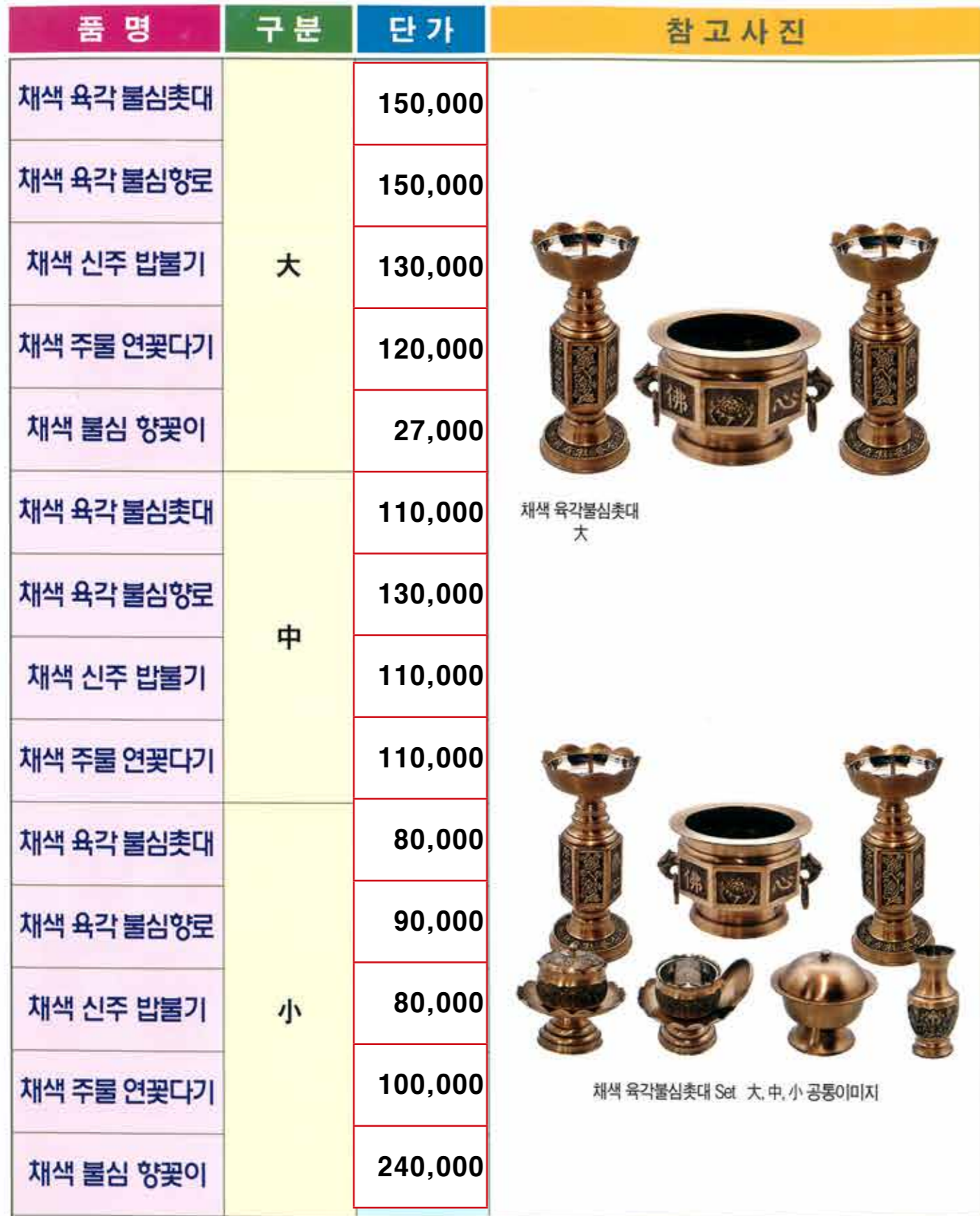
채색 육각불심촛대 大