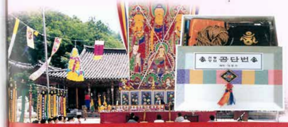
· 공단번(幡)의구성 : 삼신번(3번), 보고번, 지장번(3번), 칠여래번(7번), 아미타번, 인로왕번,