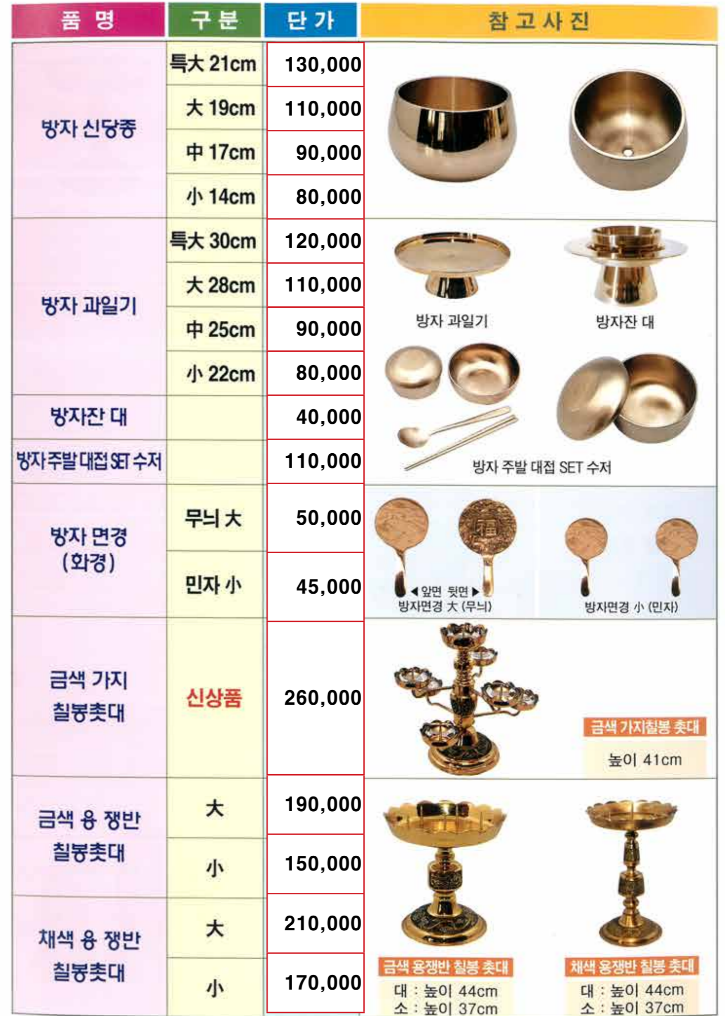
금색 가지 칠봉 촛대 높이 41cm