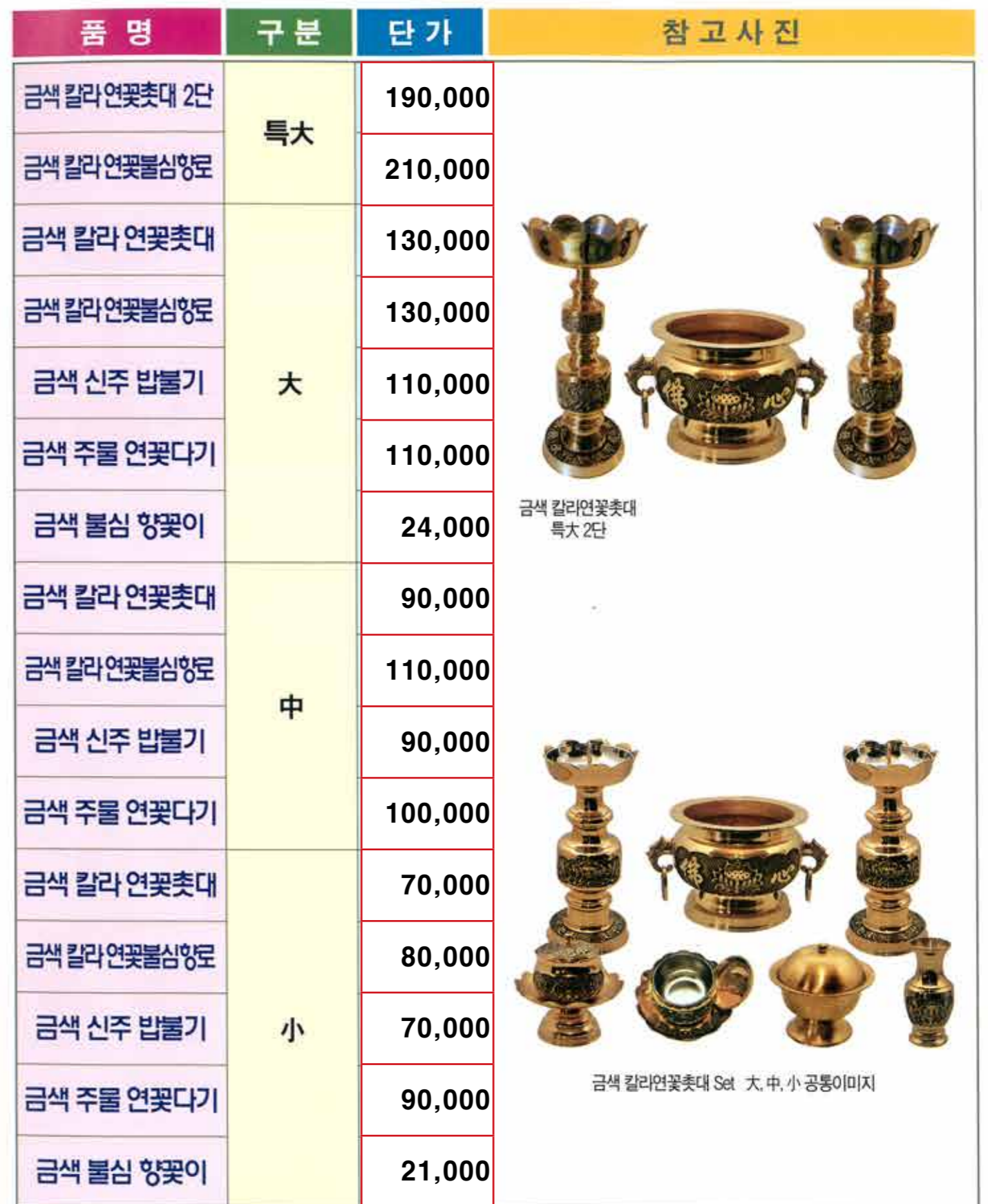
금색 칼라연꽃촛대 特大 2단