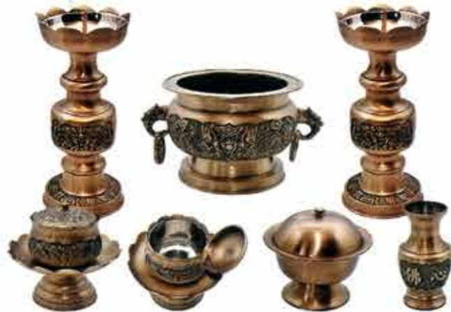
채색 칼라용촛대 Set 大, 中, 小 공통이미지