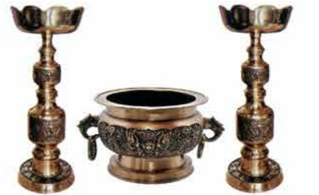
채색 칼라용촛대 특大 2단