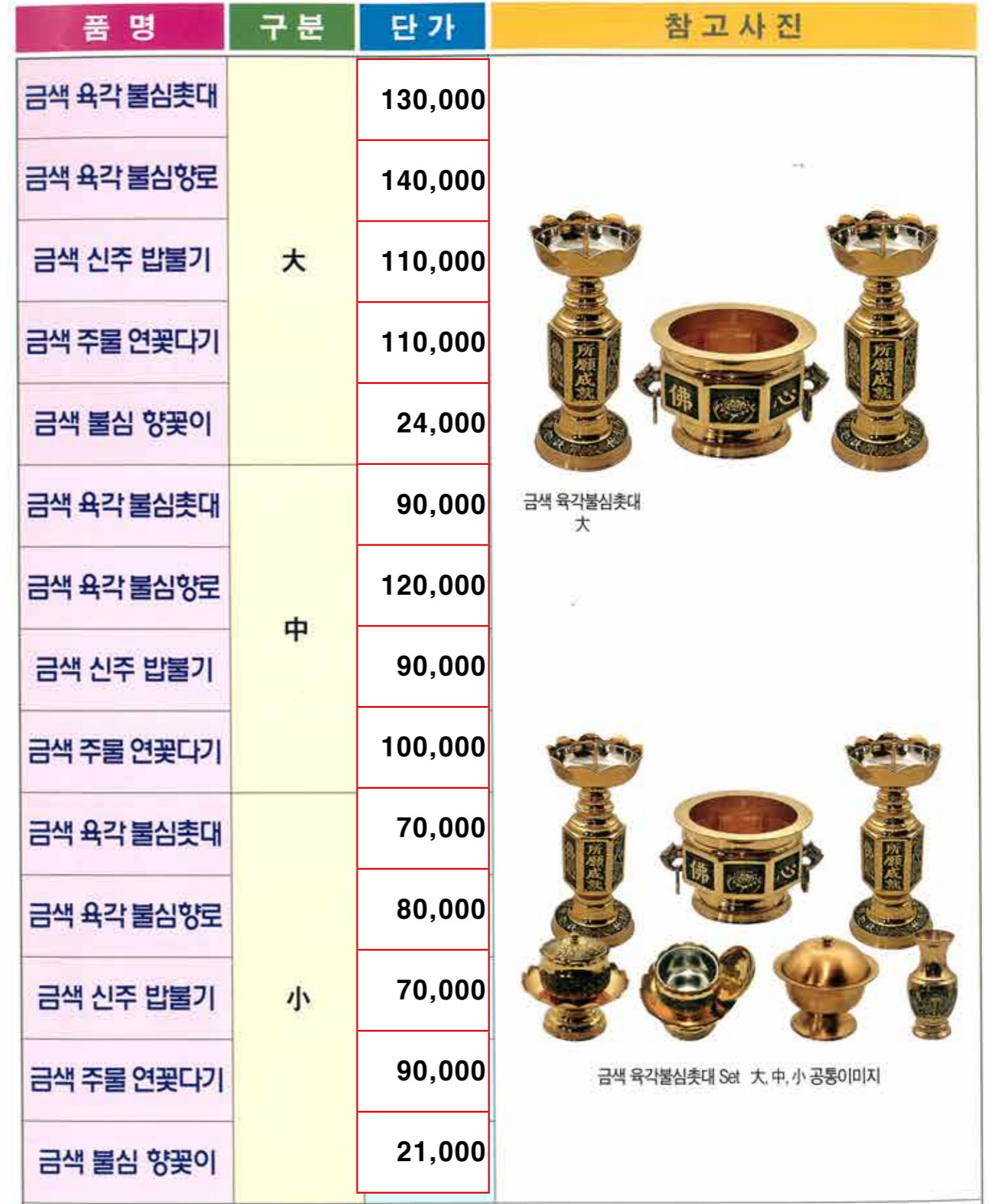
금색 육각불심 촛대 대