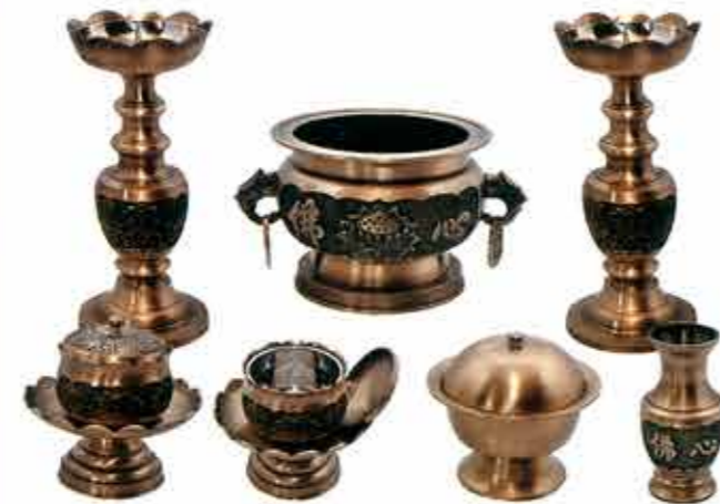
채색 연꽃불심 촛대 Set 대, 중, 소 공통이미지