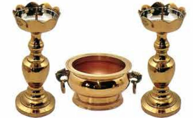
금색 민자신광촛대 특大