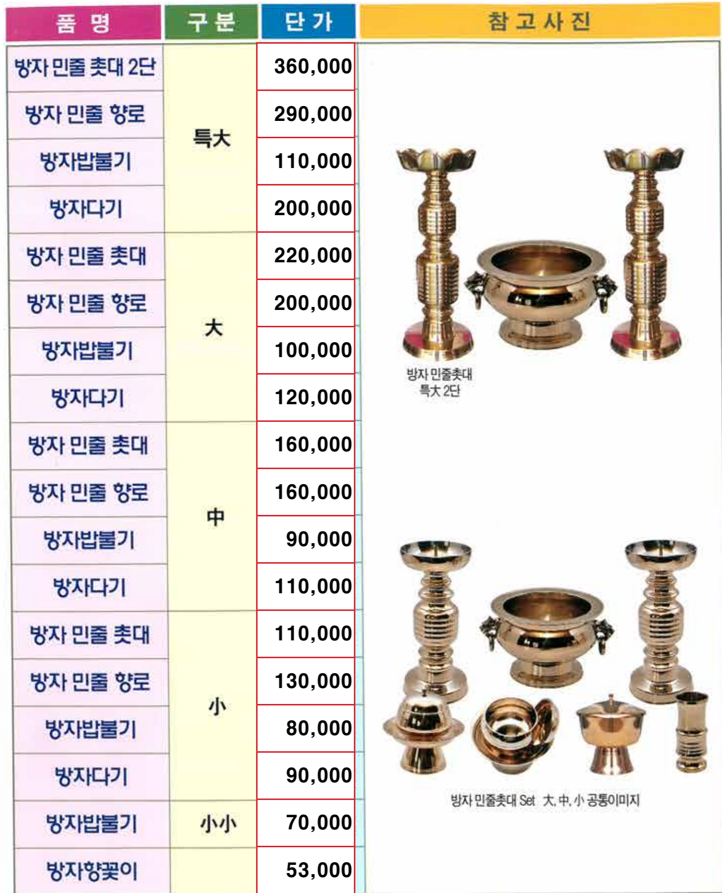
방자 민줄 촛대 특대 2단