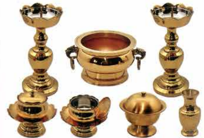
금색 민자신광촛대 Set 大, 中, 小 공통이미지